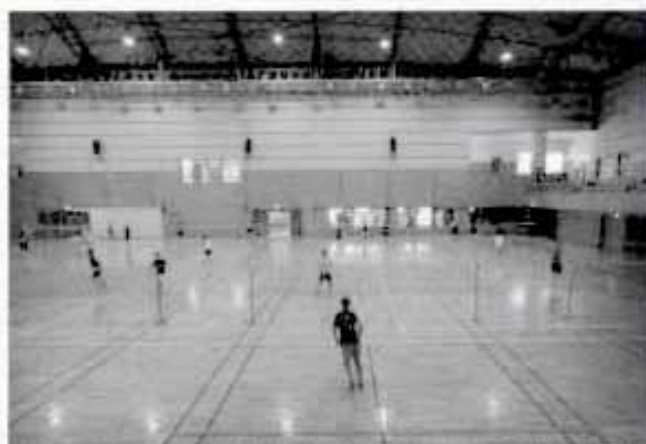
バドミントン部夏季合宿・岡山県真庭市白梅体育館

今年のバドミントン部は、第一学年に20名の入部があり、総勢40名を超える部員が当初練習をしていました。現在は3年生が抜けて約30名で毎日練習をしています。昨年新人戦においては、府下大会への出場を果たし、現在はベスト8を目指して頑張っています。写真はバドミントン部の夏季合宿の様子です。合宿は、毎年岡山県の落合総合運動公園内の白梅体育館でおこなっています。体育館は、国体用に建てられたもので、コート10面を全部借り切っておこないます。合宿は3日間ですが、2日目には、岡山県の地元の高校と練習試合を行っています。11月3日には山城高校の体育館で新人戦の団体戦がおこなわれます。応援を宜しくお願いします。